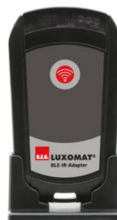
Kuva 2. Kaukosäätimet